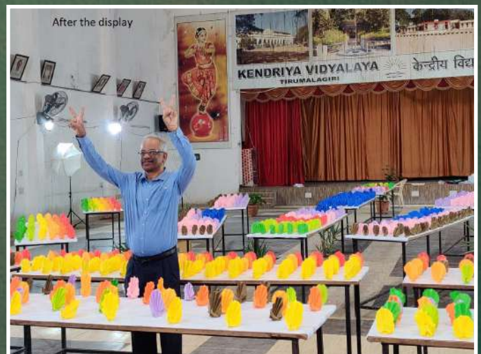
After the display