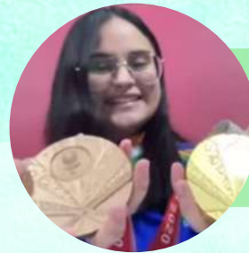
सुश्री अवनी लखेरा पैरालंपियन